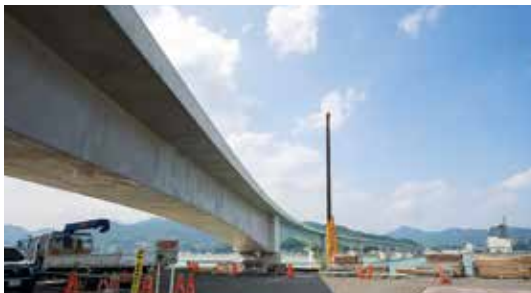
「やじろべえ工法」でつくる熊野川河口大橋。 (第1回取材：新宮市)