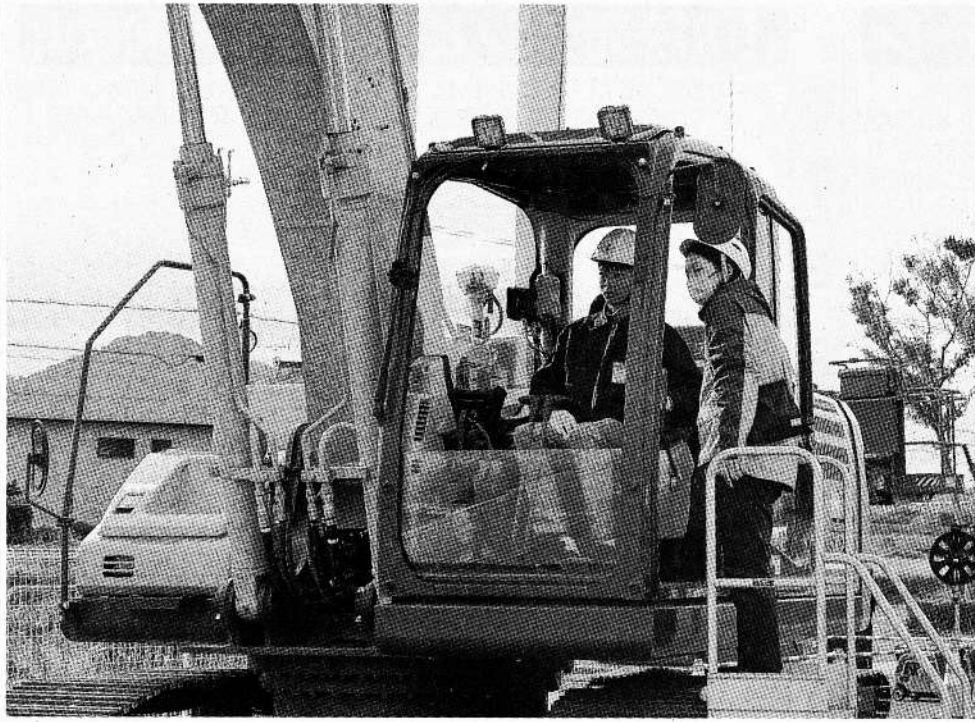
パワーショベルを操作する生徒

和歌山 土木や建設現場で作業効率を上げるICT (Information and Communication Technology=情報通信技術) を体験し、業界に興味を持ってもらうこと、和歌山市川辺の(株)アクトイ和歌山営業所で5日、体験会が開かれた。和歌山工業高校(同市西浜)と和歌山工業高等専門学校(御坊市名田町)の生徒約80人が参加し、ICT搭載の最新機械を体験した。