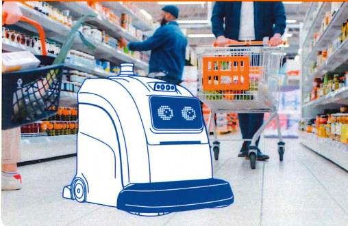
例えば、小売業 × 清掃ロボット