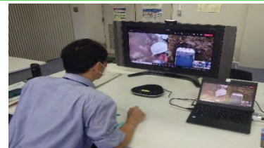
技術者が、カメラ映像を確認し、現場へ指示